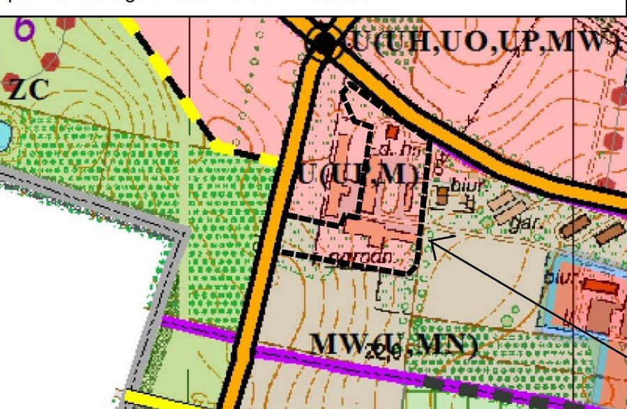
Wyrus ze Studium uwarunkowań i kierunków zagospodarowania przestrzennego miasta Pruszcz Gdański